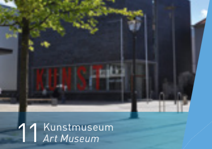
11 Kunstmuseum Art Museum