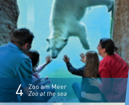
4 Zoo am Meer Zoo at the sea