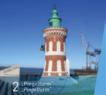
2 „Pingelturm“ „Pingelturm“