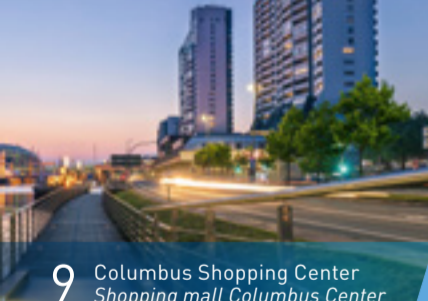
9 Columbus Shopping Center Shopping mall Columbus Center