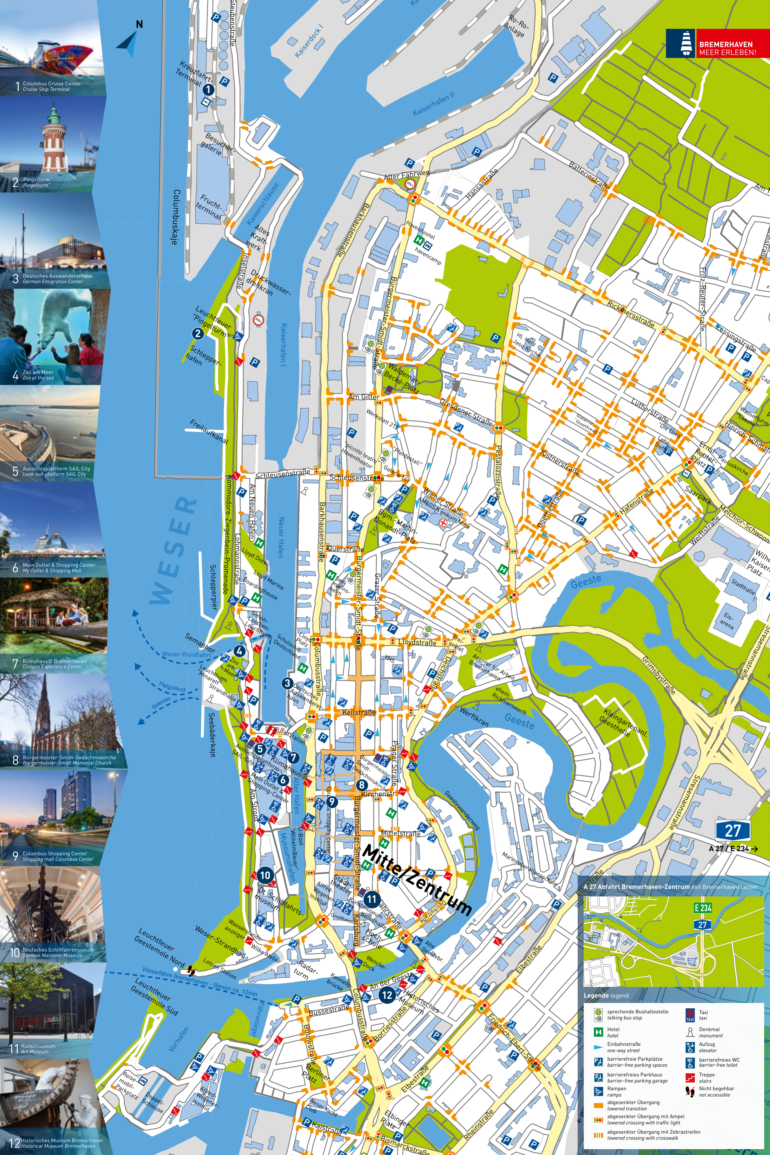
1 Columbus Cruise Center Cruise Ship Terminal