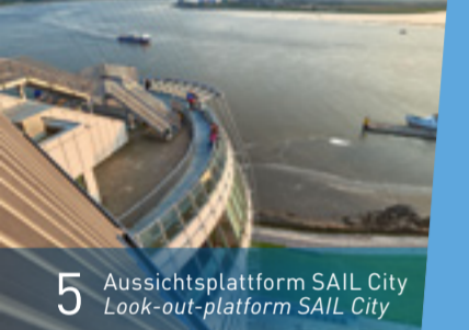
5 Aussichtsplattform SAIL City Look-out-platform SAIL City