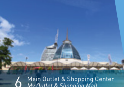
6 Mein Outlet & Shopping Center My Outlet & Shopping Mall