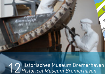
12 Historisches Museum Bremerhaven Historical Museum Bremerhaven