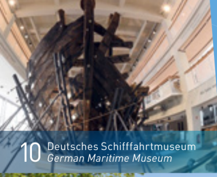
10 Deutsches Schifffahrtsmuseum German Maritime Museum