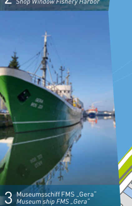
3 Museumsschiff FMS „Gera“ Museum ship FMS „Gera“