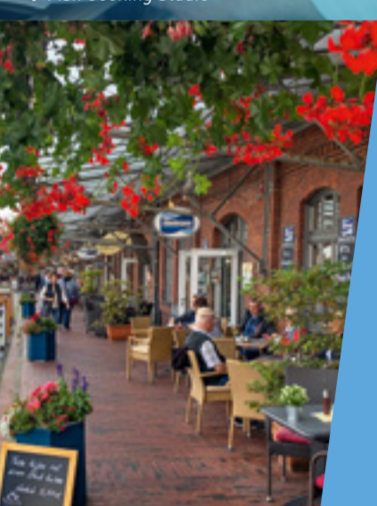
2 Schaufenster Fischereihafen Shop Window Fishery Harbor