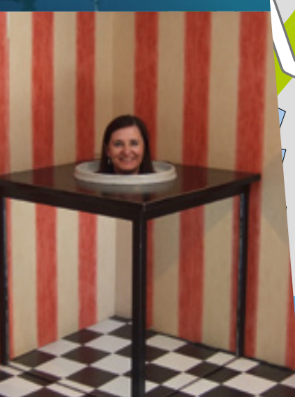
4 Erlebnisausstellung Phänomena Phänomena - The experience exhibition