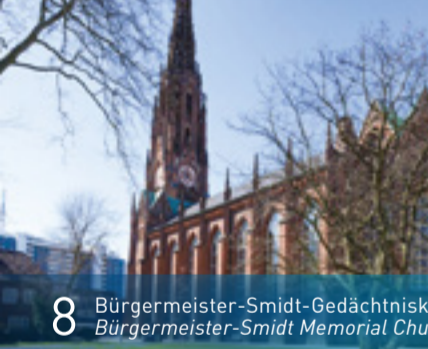
8 Bürgermeister-Smidt-Gedächtniskirche Bürgermeister-Smidt Memorial Church