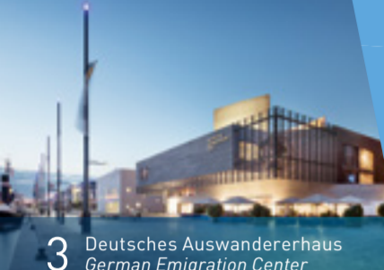
3 Deutsches Auswandererhaus German Emigration Center