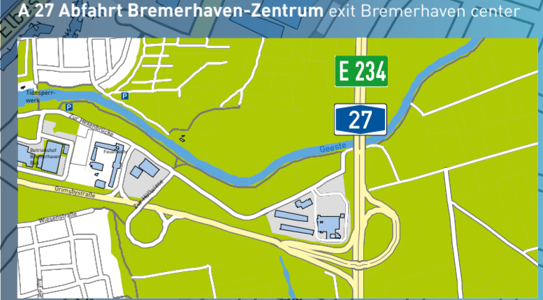
A 27 Abfahrt Bremerhaven-Zentrum exit Bremerhaven center