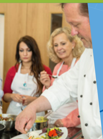
1 Fischkochstudio Fish Cooking Studio

Bremerhaven Stadtplan Bremerhaven City Map