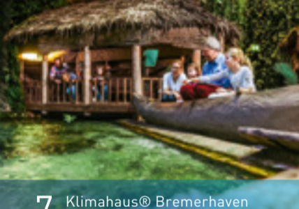
7 Klimahaus© Bremerhaven Climate Experience Center